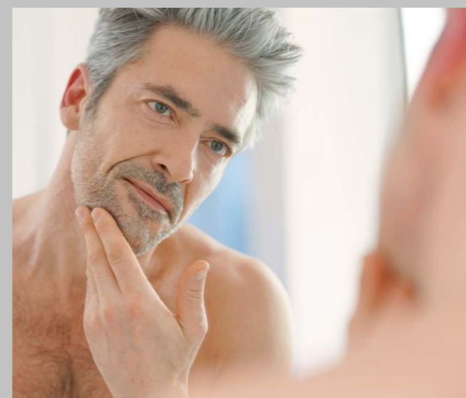
T5 warmweiß | warm white | blanc chaud