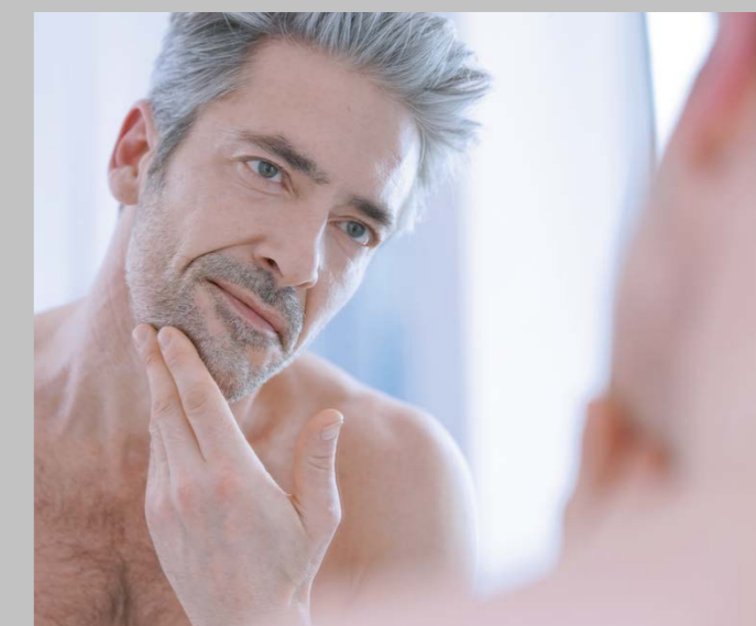
T5 cool white | cool white | blanc froid