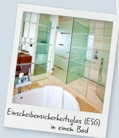
Einscheibensicherheitsglas (ESG) in einem Bad