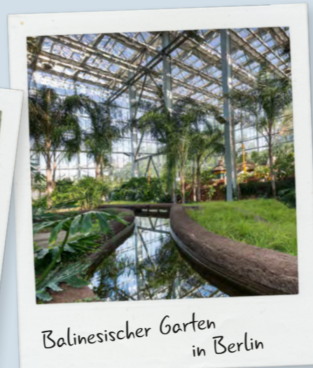
Balinesischer Garten in Berlin