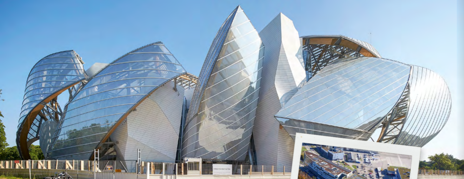
Fondation Louis Vuitton, umhüllt mit GEWE®-tvg und GEWE-dur® H.